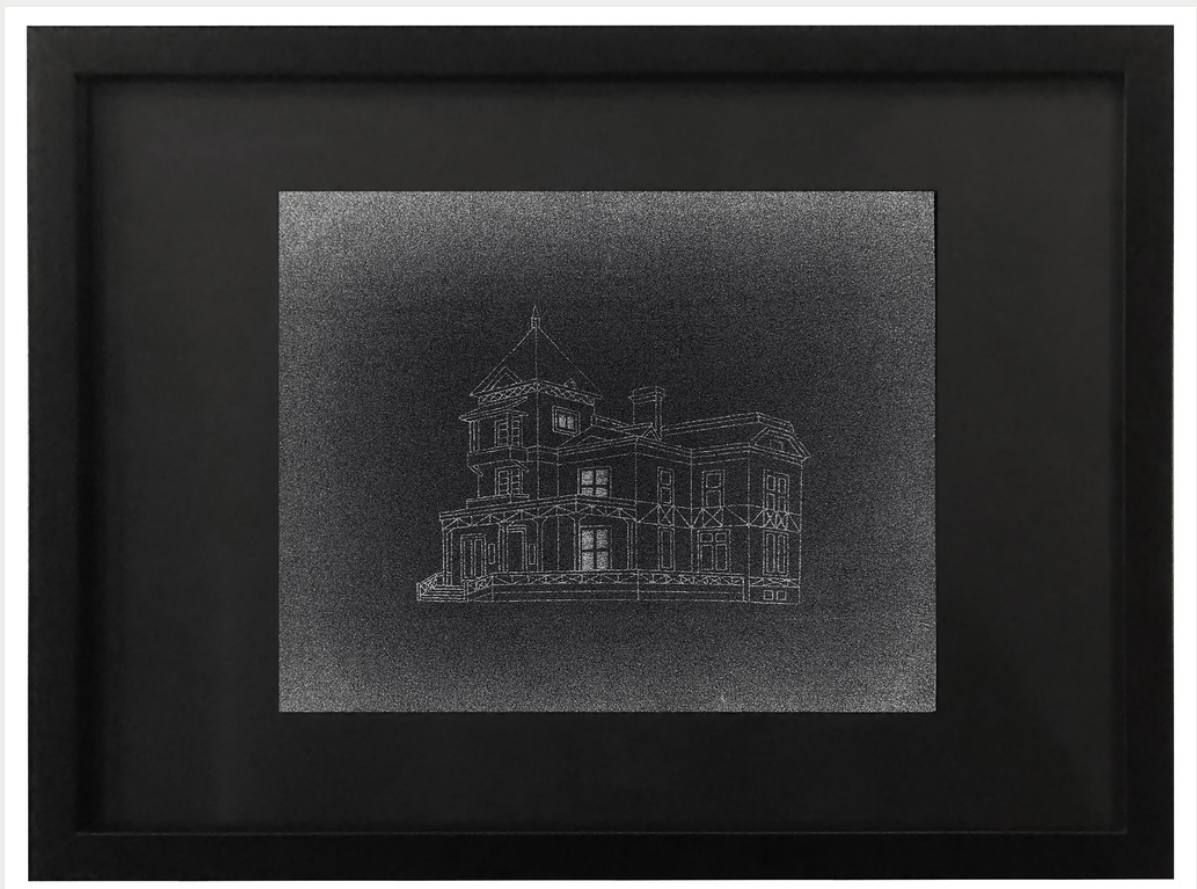
Ms Bowman, série Haunted, 2023, dessin rétro-éclairé sur papier carbone, 40 x 30 cm.