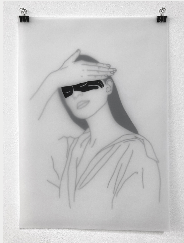
Eclipse, dessin numérique sur papier calque.

Le support est transcendé et se fait vecteur d'une narration immersive, quand la ligne et le contour deviennent un terrain de jeu pour de nouvelles recherches. L'essence du dessin, qui se définit toujours par des lignes claires chez Zoé Baraton, s'en trouve reconsidérée ; ouvrant de nouveaux territoires de perception et d'interprétation.