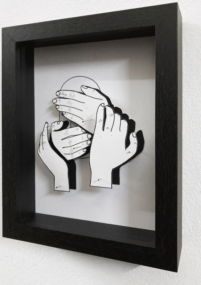
Entomologie, 2022, dessin en trois dimensions, épingles, papier découpé, 18 cm x 13 cm.

Plus seulement tracée, dessinée dirons-nous, la ligne est gravée dans le verre, perforée ou coupée au scalpel dans le papier ou bien encore révélée par un dispositif lumineux.